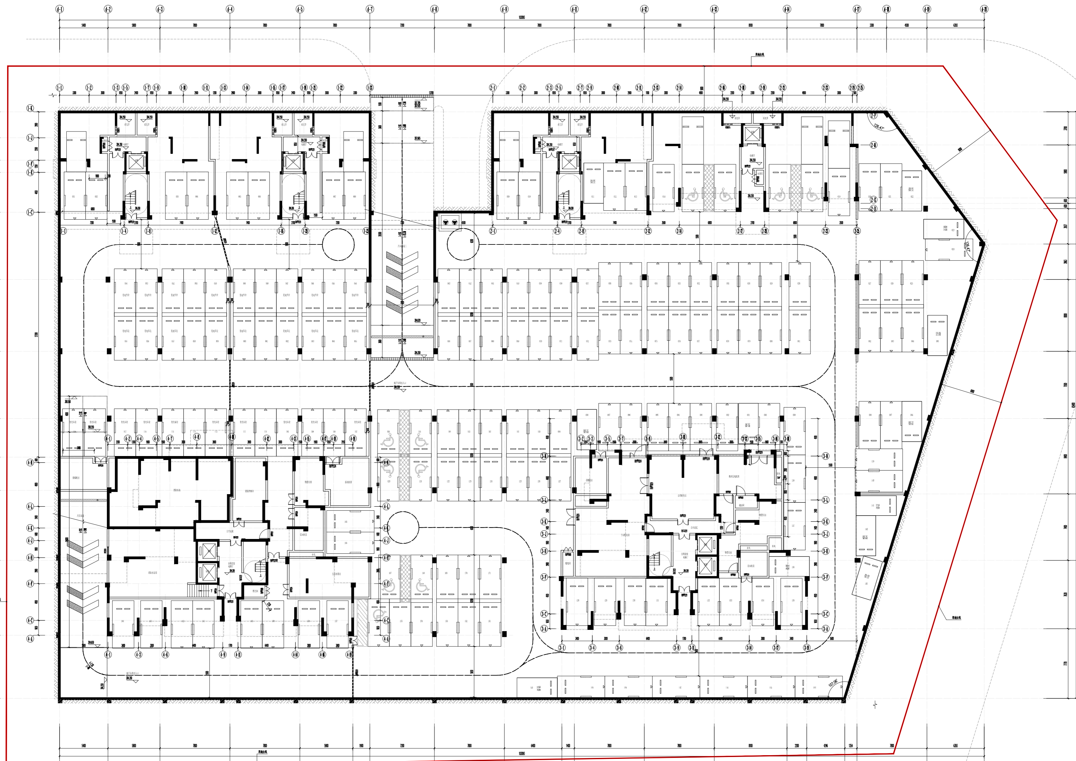
地下室平面图 1:200 车位及车道尺寸等按相关规范执行, 本设计单位对设计结果负责

地下室建筑面积: 6187.96m 2 其中物业用房建筑面积: 50.43m 2 其中设备用房建筑面积: 561.91m 2 其中地下车库建筑面积: 5575.62m 2